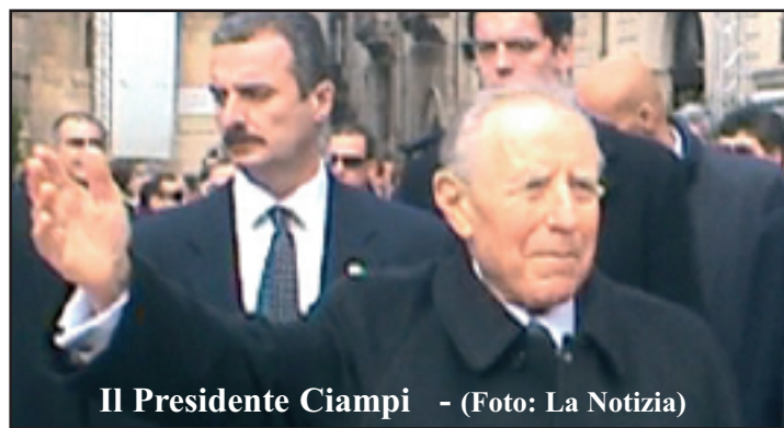
Il Presidente Ciampi