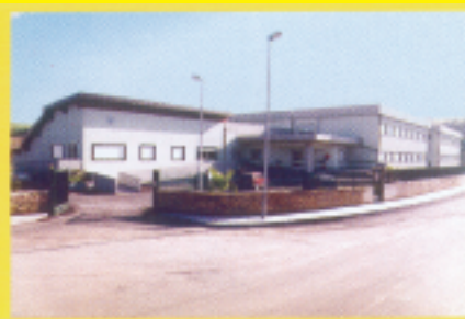
CARLENTINI ISTITUTO TECNICO INDUSTRIALE STATALE Via Cap. F. Morelli, s.n. - Tel. 095 991283

colari in termini di laboratori e progetti speciali, gestiti da collaboratori esperti e indirizzati al conseguimento dei saperi pluridisciplinari.