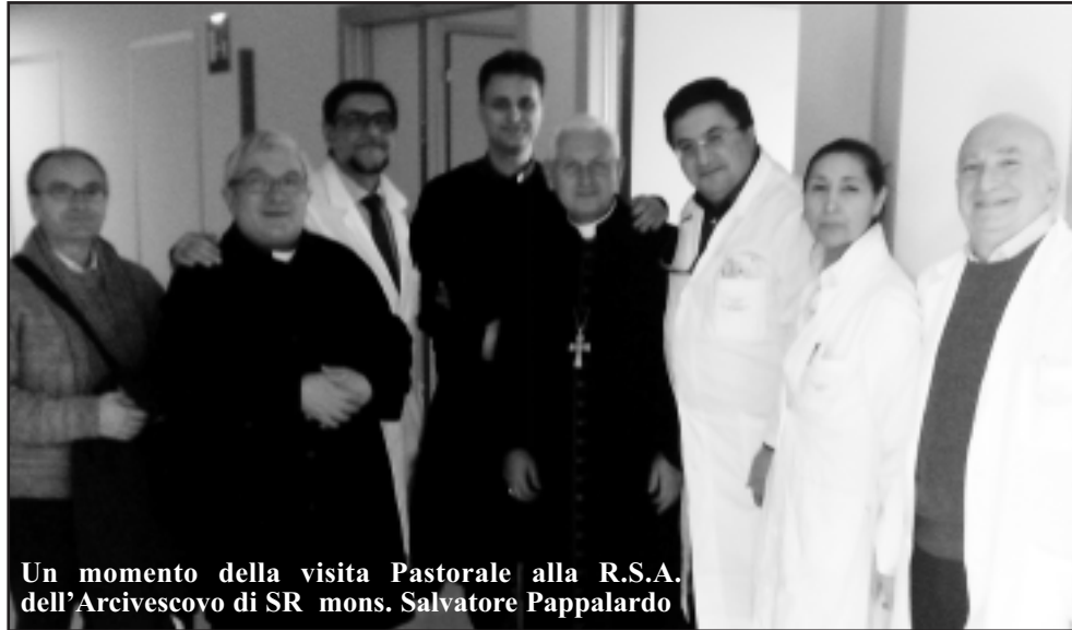
Un momento della visita Pastorale alla R.S.A. dell'Arcivescovo di SR mons. Salvatore Pappalardo

Vi è da dire, invece, che la maggioranza dei consociati svolge il proprio lavoro con serietà, met-